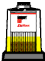
Уровень топлива остается на уровне ниже половины фильтрующего элемента

Уровень топлива в Fuel Pro первоначально устанавливается ниже нижней половины фильтрующего элемента. Фильтр создает минимальное сопротивление. По мере работы загрязнение забивает фильтр, заполняя сначала нижнюю часть. Уровень топлива поднимается в фильтре, показывая оставшийся срок его службы.