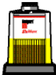
Сопротивление для проходящего потока дизеля постоянно остается низким

По мере улавливания загрязнения фильтром, уровень топлива поднимается над уровнем собранной грязи и топливо протекает через чистый фильтрующий материал, что обеспечивает низкое сопротивление для проходящего потока дизеля.