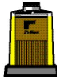
Готовность к замене

В то время как уровень топлива в фильтре остается в нижней половине фильтрующего элемента, топливо все еще проходит через чистый, новый фильтрующий материал.